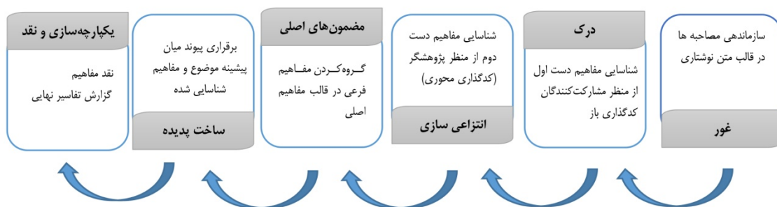
شکل ۱. شیوه تحلیل داده‌ها در رویکرد تفسیری